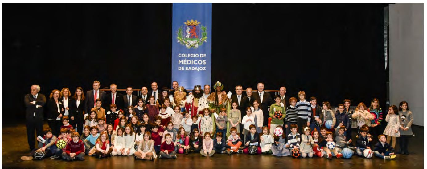
Foto de familia tras la fiesta de Reyes Magos.

4 de enero.- Este año unos 400 niños, hijos y nietos de médicos colegiados, disfrutaron de una fiesta llena de alegría en la que ellos son los auténticos protagonistas. Una vez más, el colegio hizo una donación al presidente de Cáritas Badajoz como regalo a los más necesitados.