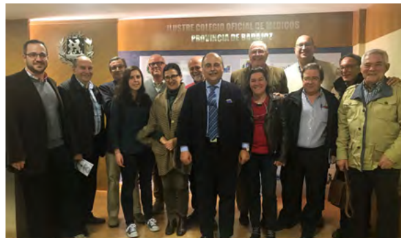
Grupo de escritores del Aula de Médicos Escritores "Felipe Trigo" con nuestro presidente.

14 de marzo.- Por iniciativa de un grupo de colegiados y con el apoyo de la JD, se ha creado el Aula de médicos escritores del icomBA. Ha tomado el nombre de Felipe Trigo, médico y escritor que desarrolló su labor en pueblos de Badajoz y del cual se celebra este año el centenario de su muerte. En el salón de grado de nuestras instalaciones se celebró la primera reunión de este aula, encabezada por los Dres. Vaz Leal y Guerrero Cabanillas.