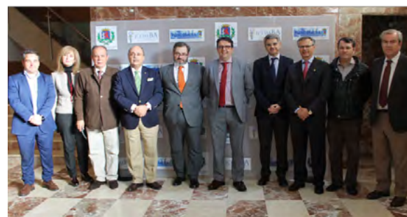
Foto de familia de autoridades y participantes en el Foro de A.P.