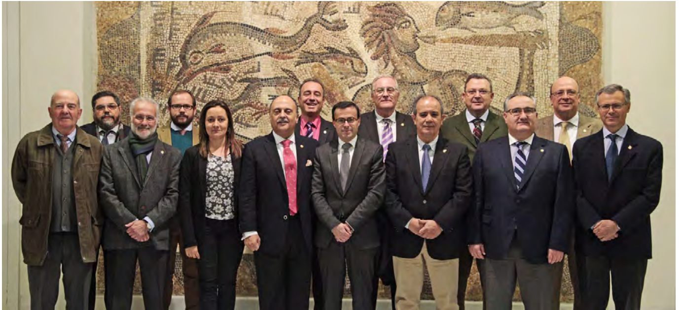
Miembros de la JD del icomBA con el presidente y la vicepresidenta de la Diputación de Badajoz.