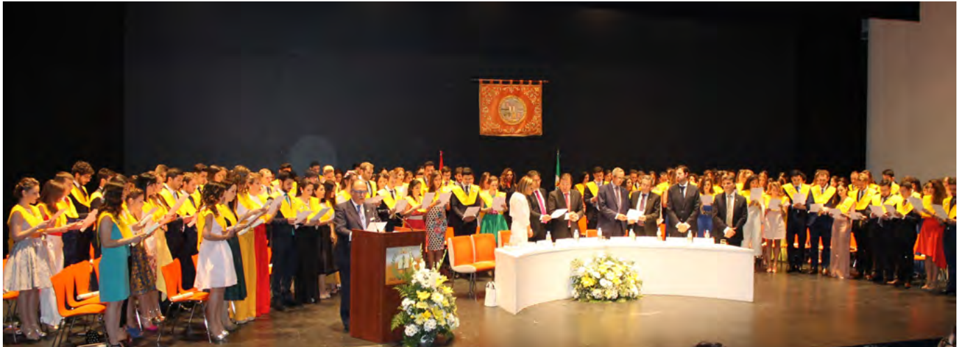
Panorámica del acto durante el juramento hipocrático.

6 de mayo.- En el Auditorio Manuel Rojas de Badajoz, se celebró el acto de graduación de los alumnos pertenecientes a la 39ª promoción de Medicina de la Facultad de Medicina de la UEX.