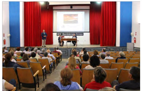
El presidente del icomBA exponiendo en la conferencia de Azuaga.