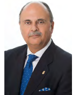
Presidente del icomBA

Toda actuación del médico – acto médico – debe regirse por el Código de Deontología Médica – Guía de Ética Médica.