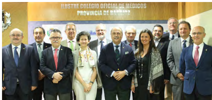
Foto de familia de la nueva comisión.