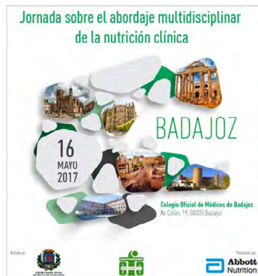
Cartel anunciador de la jornada.