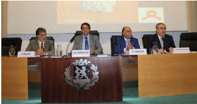
Mesa inaugural de la reunión.