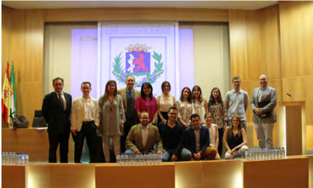
Grupo de ponentes con miembros de los jurados.

22 de mayo.- La jornada docente contó con las exposiciones de los 7 casos finalistas del VII certamen de Casos Clínicos del IcomBA y de los 3 casos finalistas del I Certamen de Casos de Deontología Médica, abierto en este año a todos los colegiados.