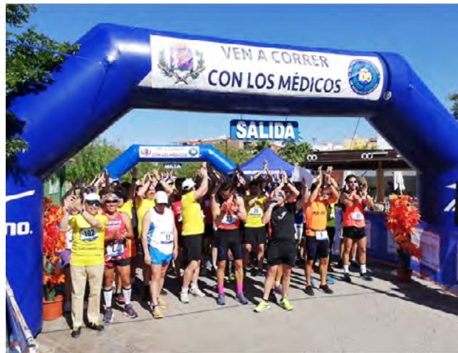
Momento previo a la salida

1 de junio - En el parque de la margen derecha del Guadiana a su paso por Badajoz, celebramos la II Carrera "Ven a correr con los Médicos", en la iniciativa de compartir los valores del deporte no competitivo y la convivencia entre médicos y pacientes más allá de las consultas. El ejercicio moderado como parte de un estilo de vida saludable para el mantenimiento de la salud, apoyado por el médico y junto al médico.