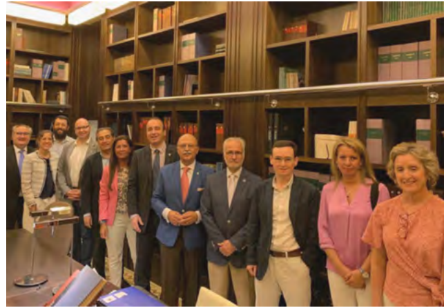
Miembros de los jurados de ambos certámenes y de JD del IcomBA.

22 de mayo - En el Salón de Actos del IcomBA, se celebró la jornada docente con las exposiciones de los 7 casos finalistas del IX certamen de Casos Clínicos del IcomBA y los dos finalistas del III Certamen de casos de Deontología Médica ante los médicos presentes y los Comités científicos de los mismos. Todos los colegiados asistentes pudieron participar y votar los casos a premiar.