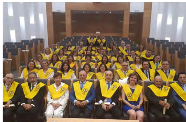
Autoridades Alumnos y Profesores presentes en el acto.