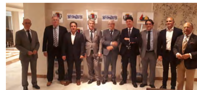
Autoridades presentes en la inauguración con los tres ponentes de esta edición.