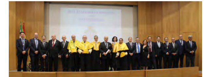
Académicos de número y de honor.

La Academia de Medicina de Extremadura (AMedEx) ha sido creada bajo el patronazgo de la Facultad de Medicina de Badajoz y con el apoyo de los Colegios Oficiales de Médicos de Badajoz y de Cáceres. La Academia nace como heredera ideológica de la extinta Academia Provincial de Ciencias Médicas de Badajoz y de todas las instituciones que desde entonces han hecho del desarrollo del conocimiento médico y de la promoción de la calidad de la asistencia, su razón de ser.