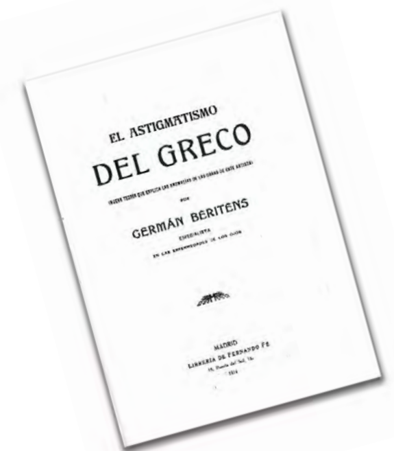
Portada del libro El astigmatismo del Greco publicado por Germán Beritens en el año 1914.

Finalmente, si bien desconocemos el motivo por el que el pintor cretense representaba las figuras alargadas en determinadas obras, una vez más en la conferencia presentada en el Colegio Oficial de Médicos de Badajoz, se descartó el astigmatismo de El Greco como causa de la estilización de las figuras representadas en su inmensa obra.